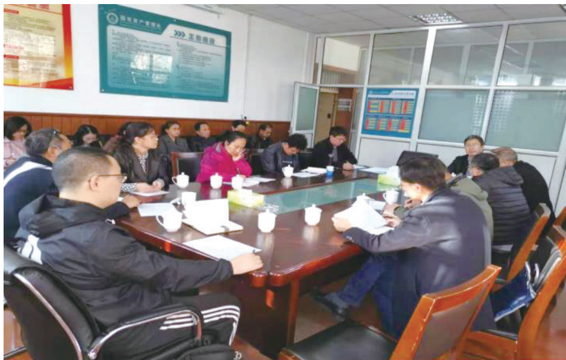
理工科实验室安全考核工作布置