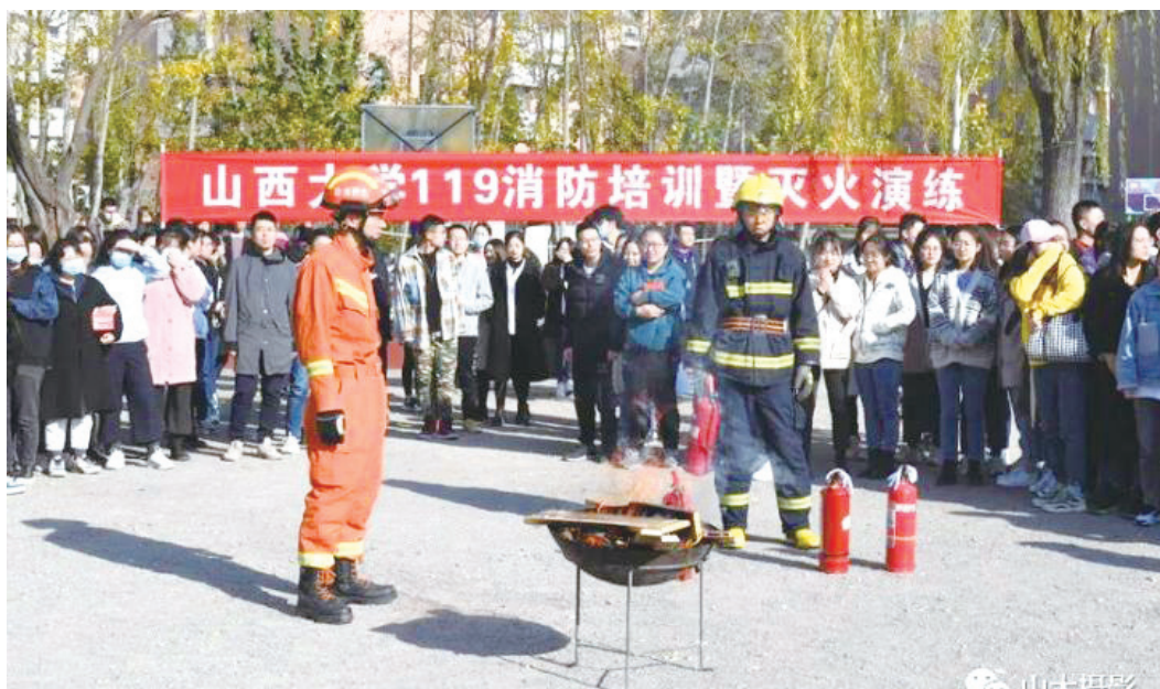
2020年“119”消防日活动现场